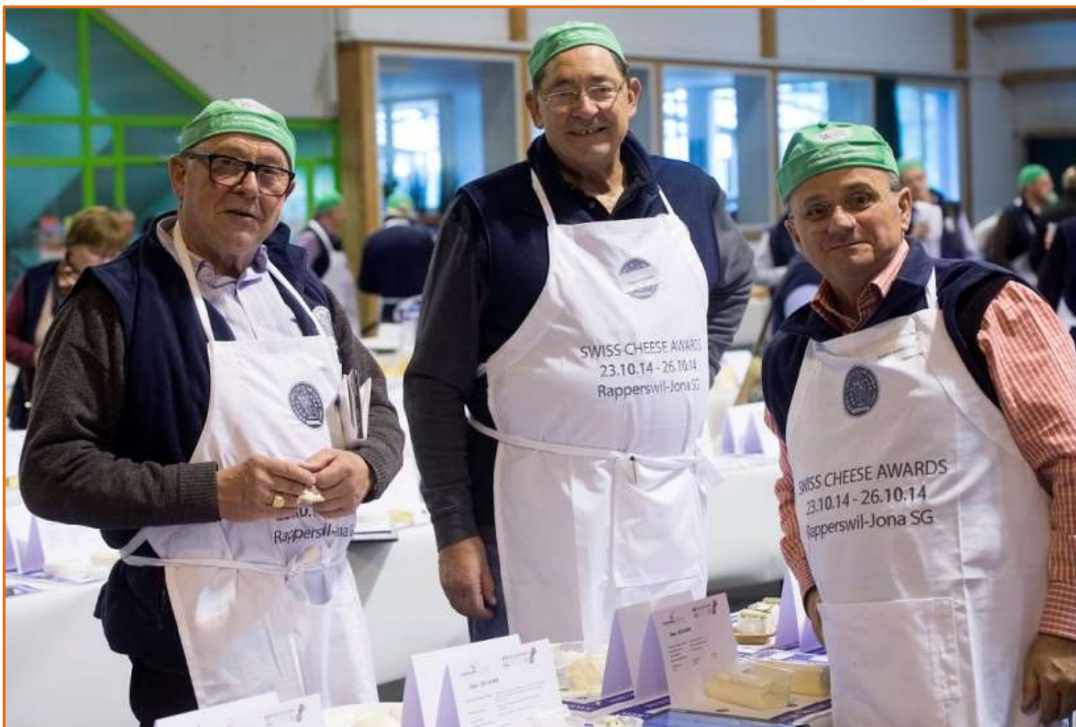
„LA TRILOGIE“ DE LA GUILDE INTERNATIONALE DES FROMAGERS