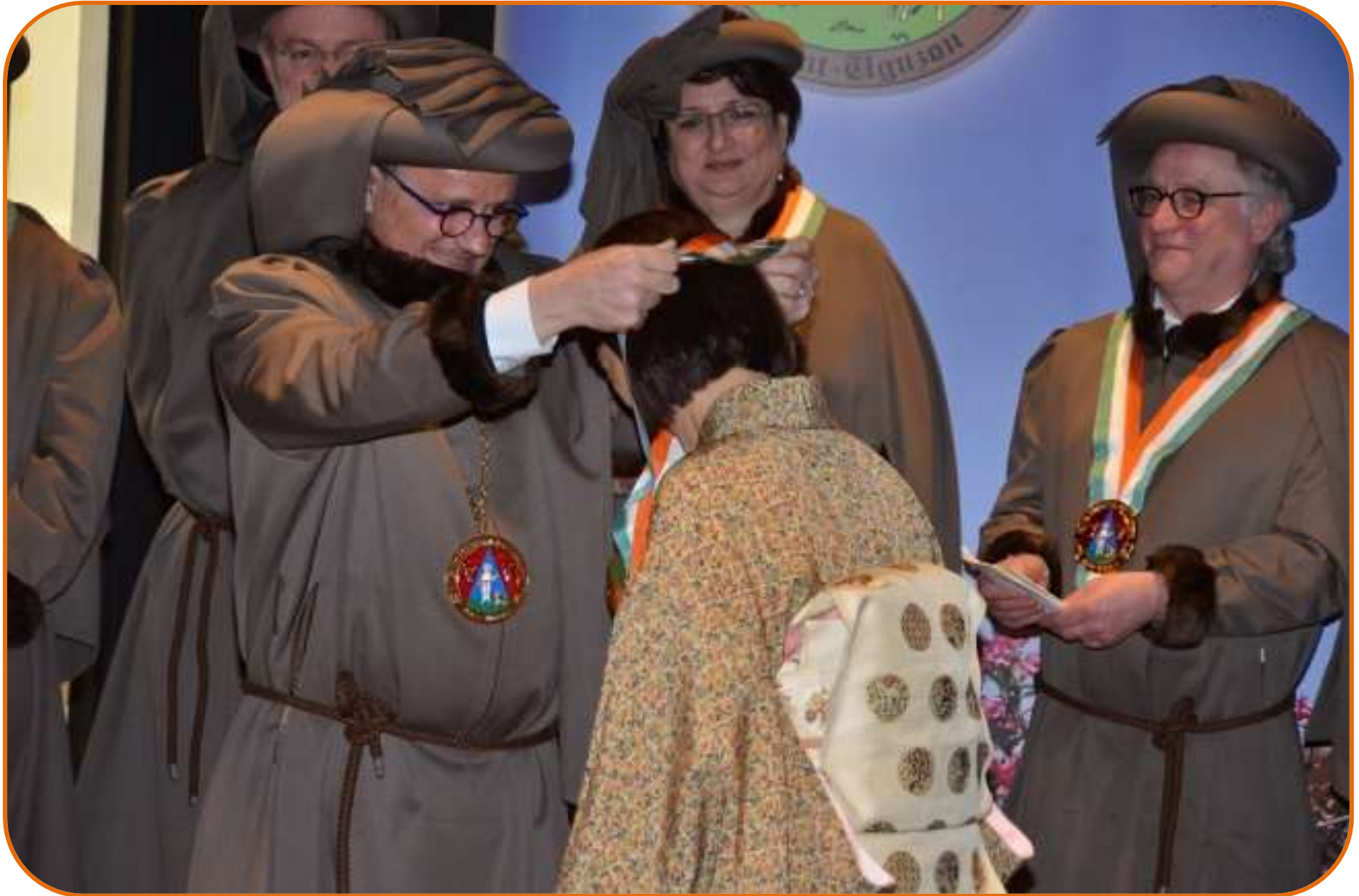
PROMUE "MAÎTRE HONORIS CASEUS"