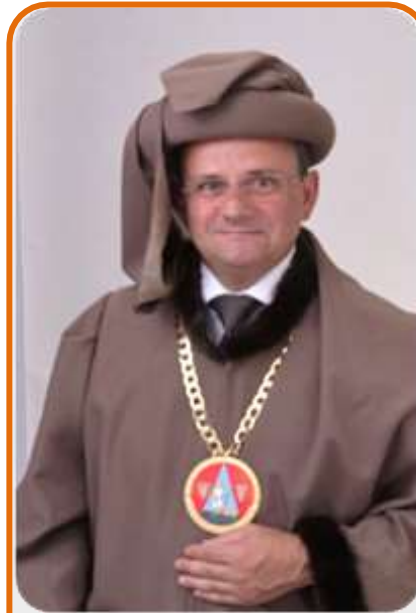
PRÉVÔT DE LA GUILDE