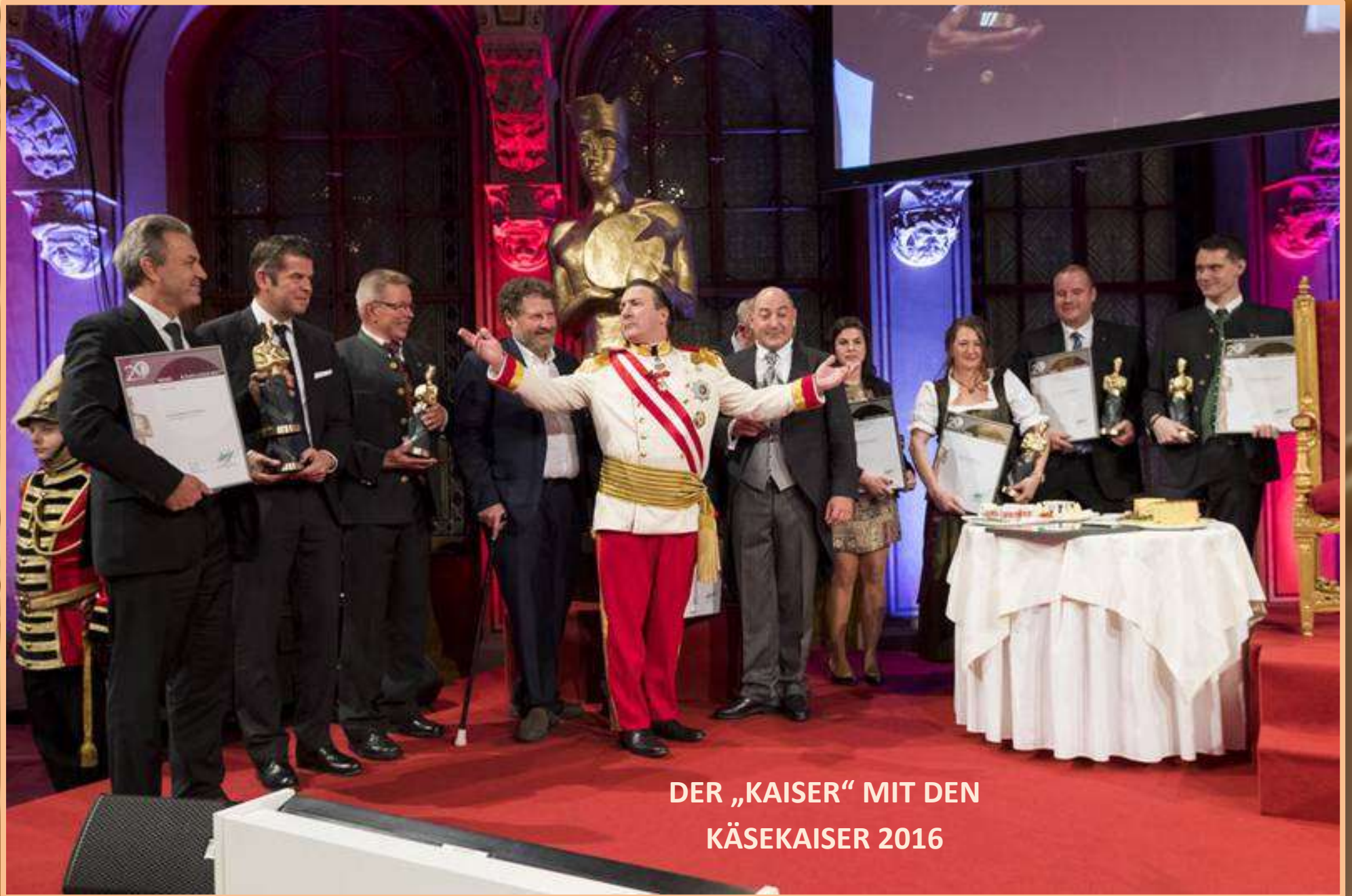
DER „KAISER“ MIT DEN KÄSEKAISER 2016