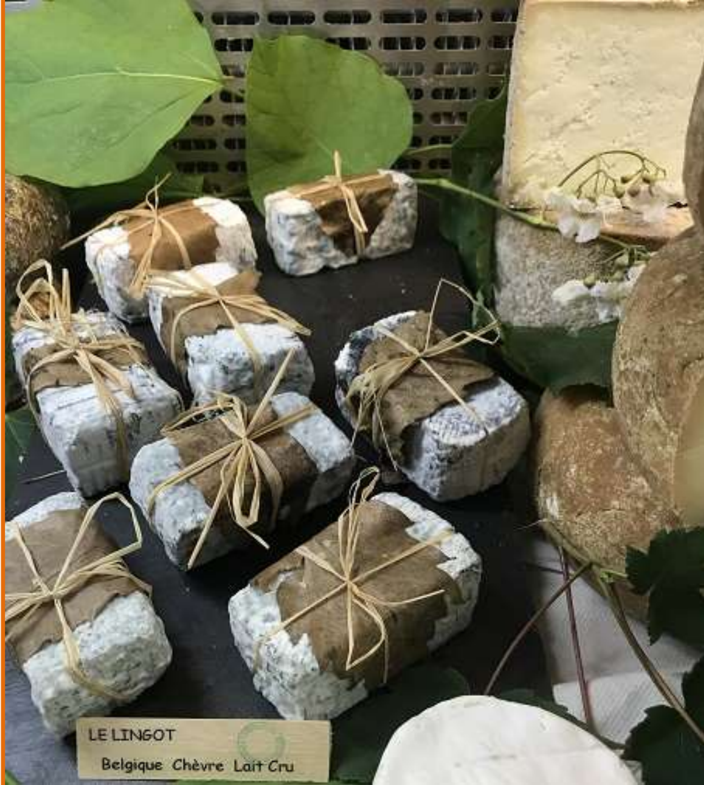
LE LINGOT Belgique Chèvre Lait Cru