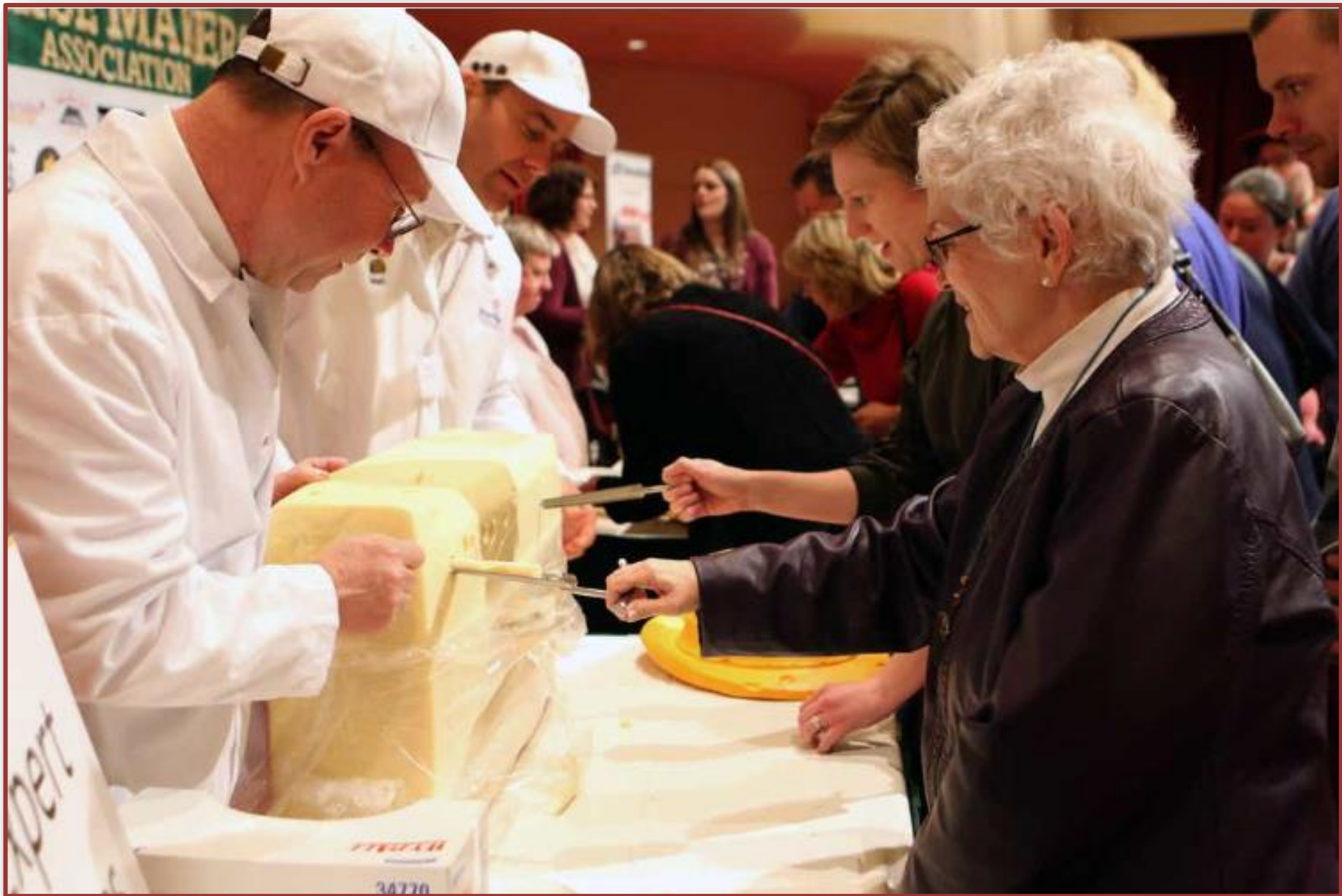
Three Wisconsin cheesemakers take top 20 honors at World Championship Cheese Contest