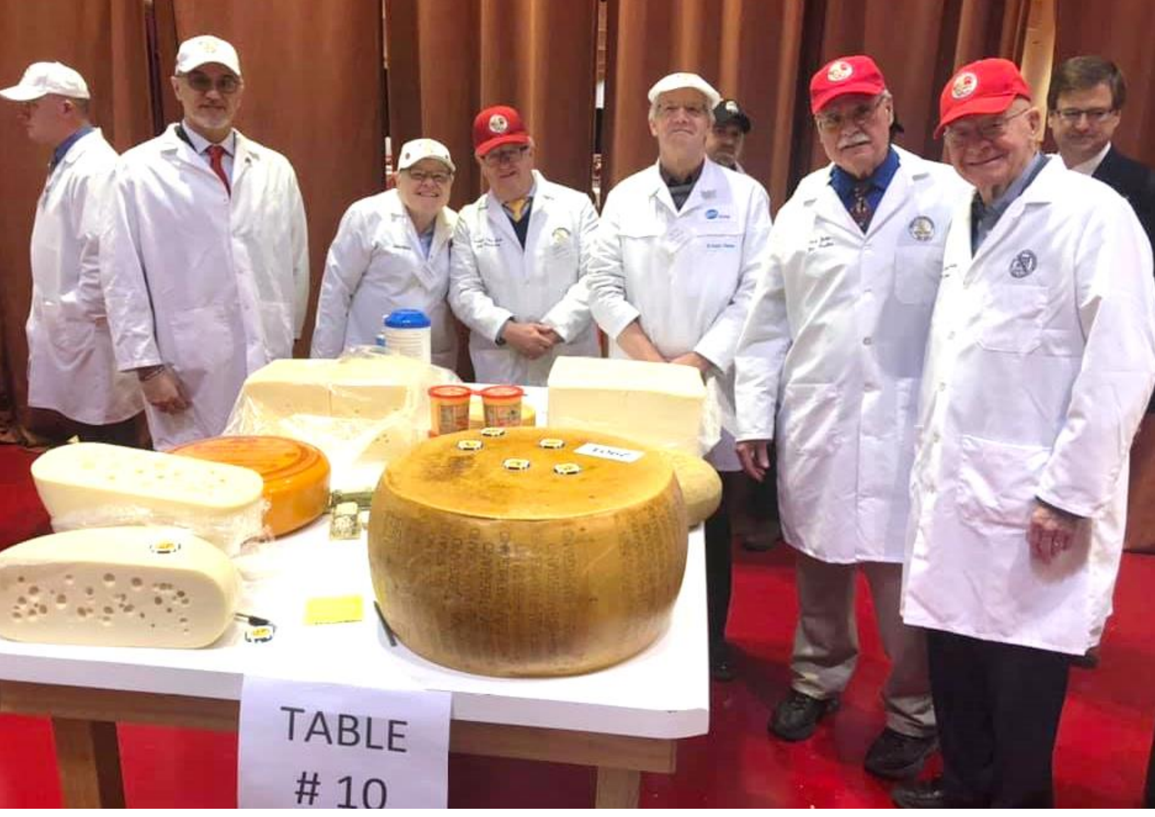
TABLE # 10