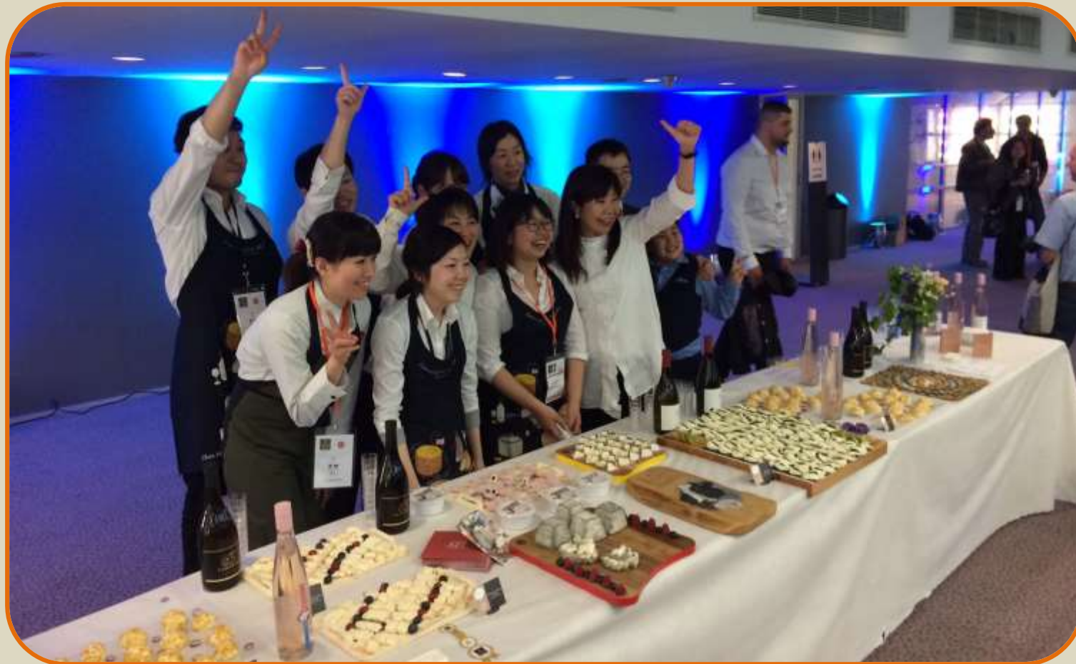
JAPANISCHES KÄSE-BÜFFET VON DER FROMAGERIE HISADA - PARIS